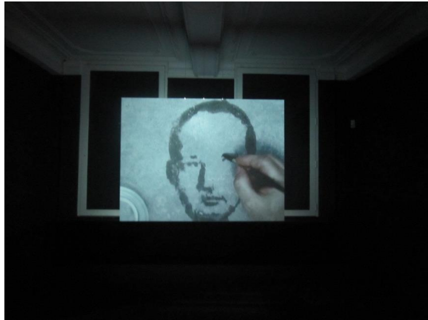
Re-trato , 2004, Óscar Muñoz

De eerste ruimte toont een projectie waarin een portret getekend wordt. Er wordt getekend met water op een door zon verhitte steen, waardoor het gezicht steeds vervaagt als een droom bij het wakker worden. Het werk van Óscar Muñoz oogt misschien eenvoudig, maar vormt een krachtige metafoor voor het constant veranderende geheugen.