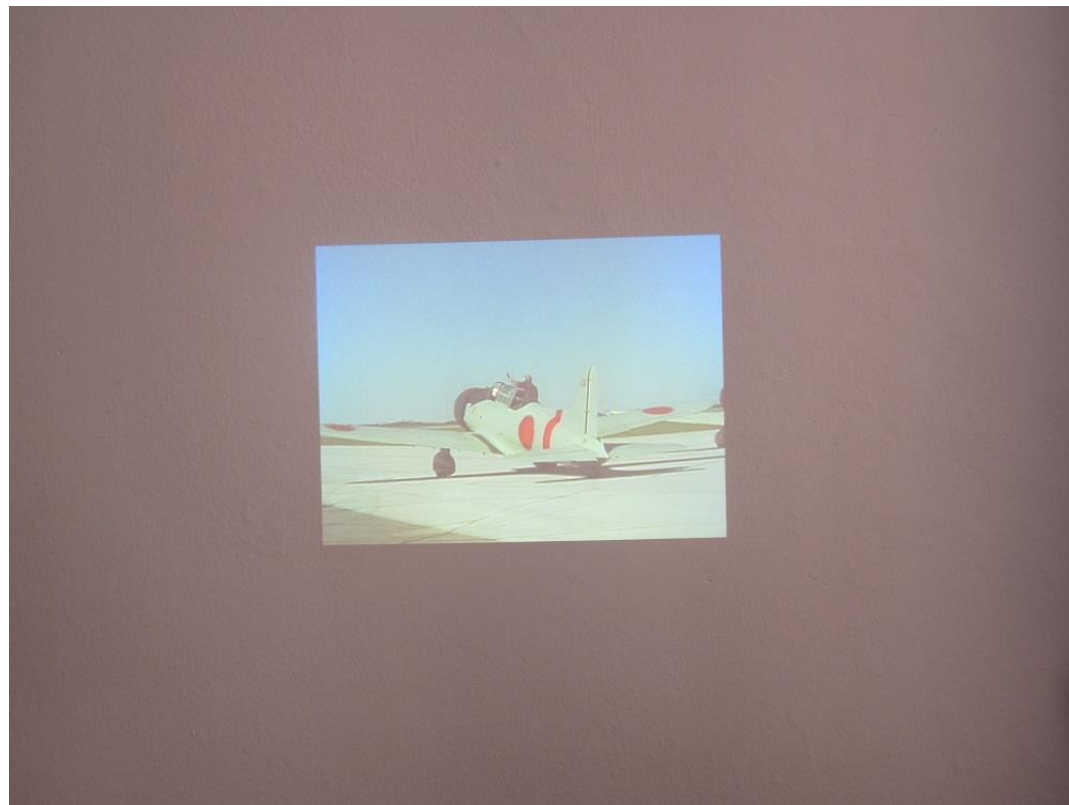
Tibbet's Re-anactment (fragment ABC News, oktober 1976), 2010, Gert Jan Kocken

Lopend door een prachtige gang vind ik mijzelf naast tussen twee beeldschermen waarop twee vrouwen in tegengestelde richting in dezelfde stad lopen: Londen . Kunstenaar Koki Tanaka laat ze dezelfde weg lopen als ze deden tijdens de rellen van drie jaar geleden. In mijn herinnering flikkeren de nieuwsbeelden weer langs: plunderingen, vernielingen en totale chaos namen de stad over en ik kan me inbeelden hoe surrealistisch het moet zijn geweest om daar te lopen. Het gekozen perspectief doet me denken aan de film Elephant van Gus van Sant over de schietpartij op Columbine . Er schuilt geen dreiging in de kleurrijke beelden zelf, maar in het donkere verhaal erachter.