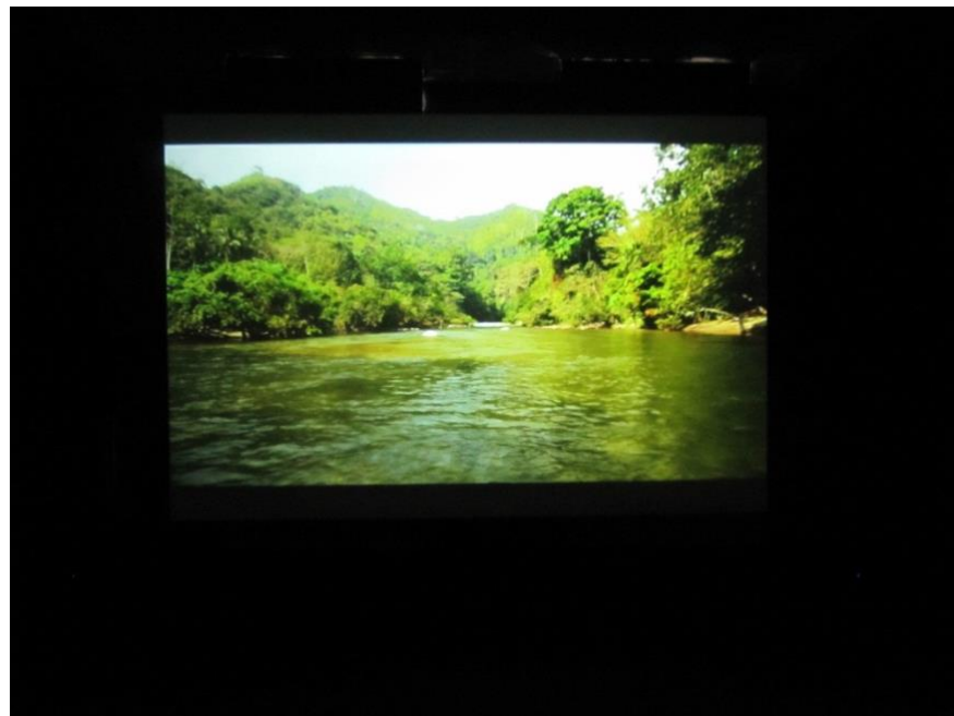
Nefandus , 2013, Carlos Motta

De eerste ruimte toont een projectie waarin een portret getekend wordt. Er wordt getekend met water op een door zon verhitte steen, waardoor het gezicht steeds vervaagt als een droom bij het wakker worden. Het werk van Óscar Muñoz oogt misschien eenvoudig, maar vormt een krachtige metafoor voor het constant veranderende geheugen.