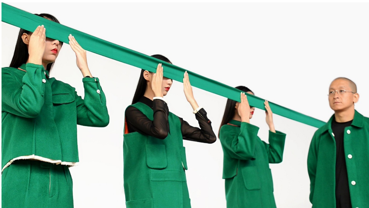
Liu Chengrui, Punish Proud , 2015

Van 26 november tot en met 8 januari 2017 in Marres @ Wiebengahal Maastricht