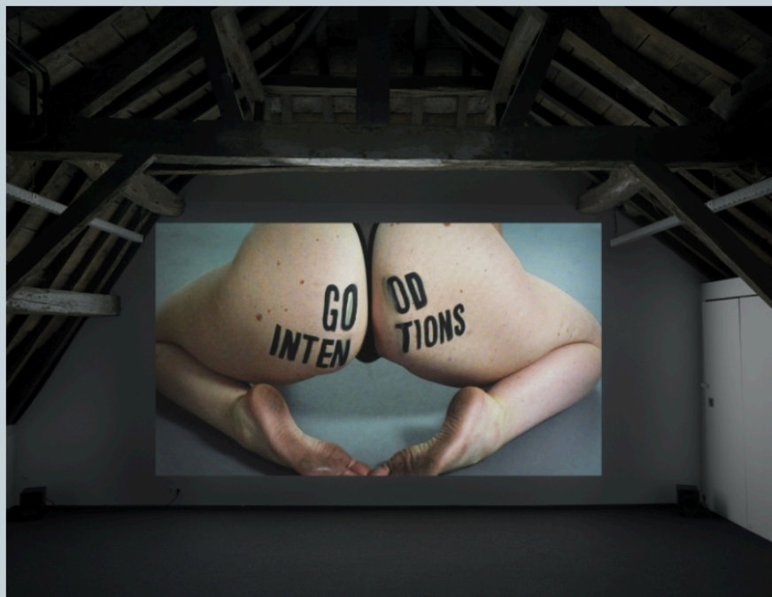
Liesel Burisch, 'Good Intentions', 2018, installatiezicht, foto Gert Jan van Rooij

Tijdens de zomer van 2018 bezochten de drie curatoren van Marres Currents #6 in totaal 18 eindejaarstentoonstellingen van evenveel kunsthogescholen in België, Nederland en Duitsland. Met gezwindde tred en een helder, zelfopgelegd selectie criterium als uitgangspunt weerhielden ze in totaal 17 kunstenaars. Of beter: 17 doordachte, zelfbewuste praktijken die getuigen van inzicht, kritische massa, doorzetting, en die de mogelijkheid kregen zich verder te ontwikkelen in de aanloop naar de tentoonstelling. Want behalve een jaarlijkse groepstentoonstelling omvat Marres Currents ook een ruimer begeleidingstraject, waarin training, netwerk en professionalisering centraal staan.