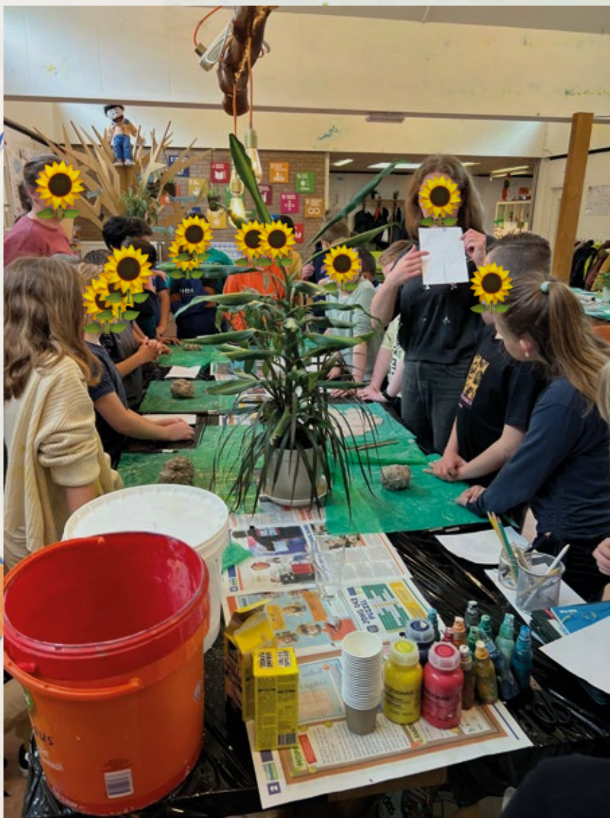
Het Wordt Heet Onder De Wortels