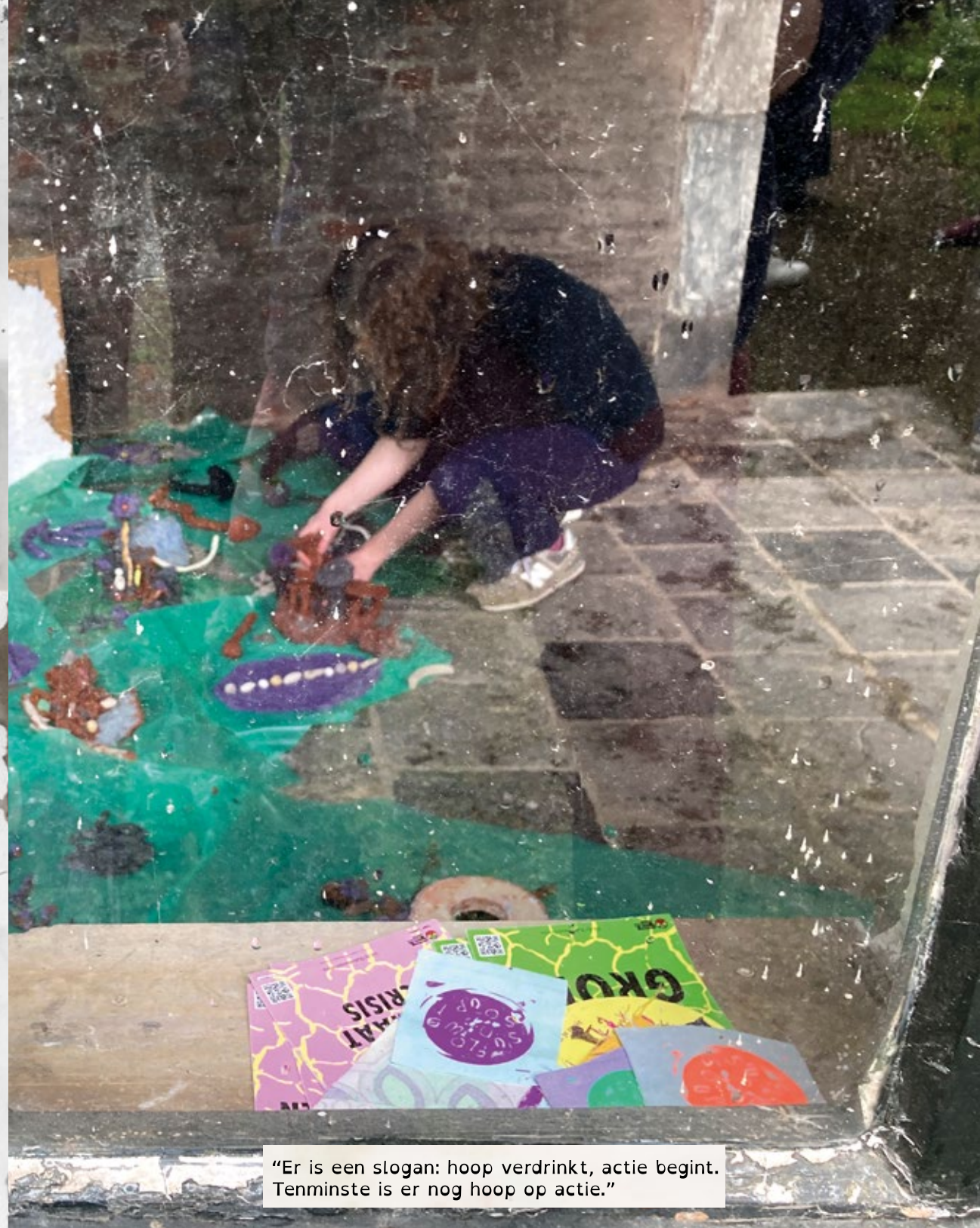
"Er is een slogan: hoop verdrinkt, actie begint. Tenminste is er nog hoop op actie."