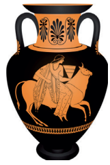
Amfora Europa en de stier

Is dit een imitatie (naar het origineel), is het een variatie (het origineel is veranderd) of een aemulatie (het overtreffen van het thema)? Beargumenteer je antwoord.