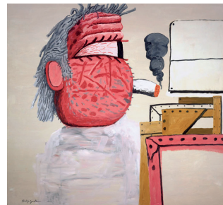
Philip Guston, Painter's Head, 1975