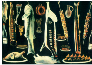
Niko Pirosmani 1862 - 1918