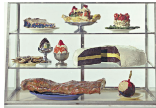
Claes Oldenburg - Pastry Case I, 1961-62 Sculptures Musée Guggenheim Bilbao