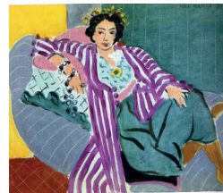
Henri Matisse 1869 - 1954