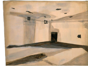
Luc Tuymans Gaskamer (Gas Chamber) 1986